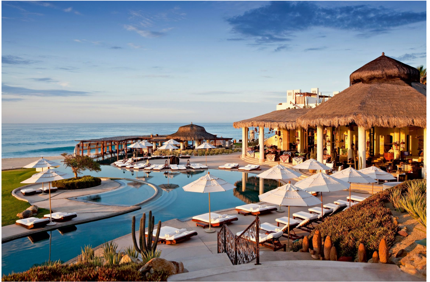
San José del Cabo

Wie der Garten Eden erscheint dieses exklusive, sehr persönliche Hotel und verzaubert auch anspruchsvollste Gäste.