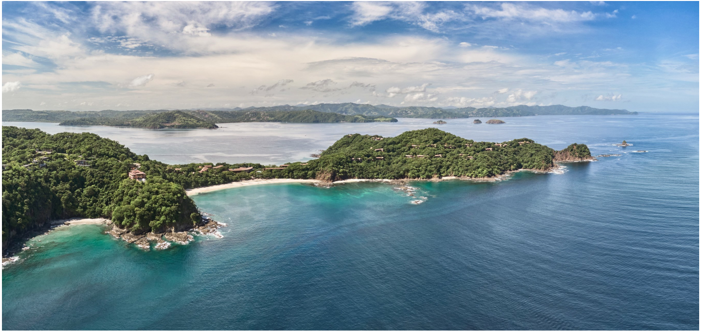
Golfo de Papagayo

Umgeben von Regenwald und flankiert von den zwei langen, goldfarbenen Stränden, lädt diese exklusive Anlage zum Relaxen und Sich-verwöhnen-lassen ein.