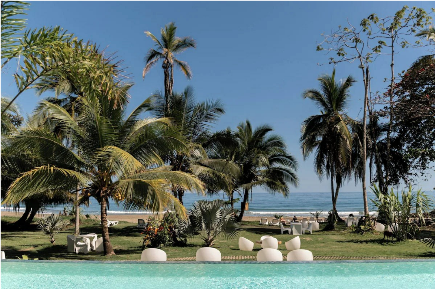
Puerto Viejo de Talamanca

Dieses Boutiquehotel besticht durch das moderne Design und die luxuriöse Einrichtung.