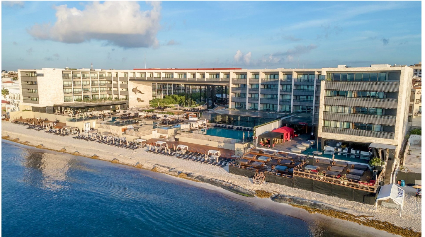
Playa del Carmen

Modernes Adults-only-Luxushotel mit stilvollem Design und urbanem Resort-Charakter, ideal für Gäste, die Strandnähe, Komfort und Lifestyle schätzen.