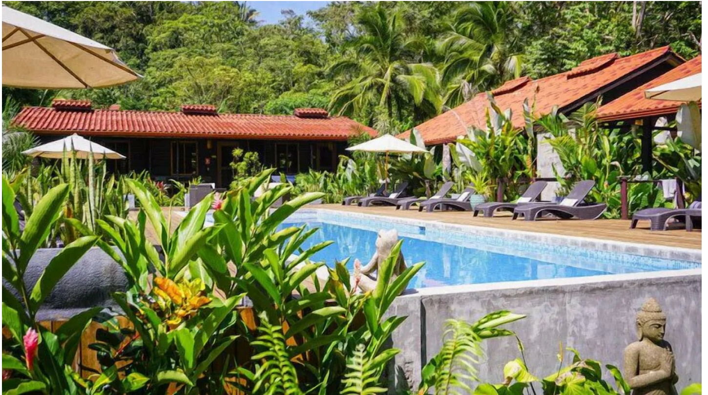
Bocas del Toro

Das Island Plantation ist ein kleines, persönlich geführtes Hotel im balinesischen Stil.