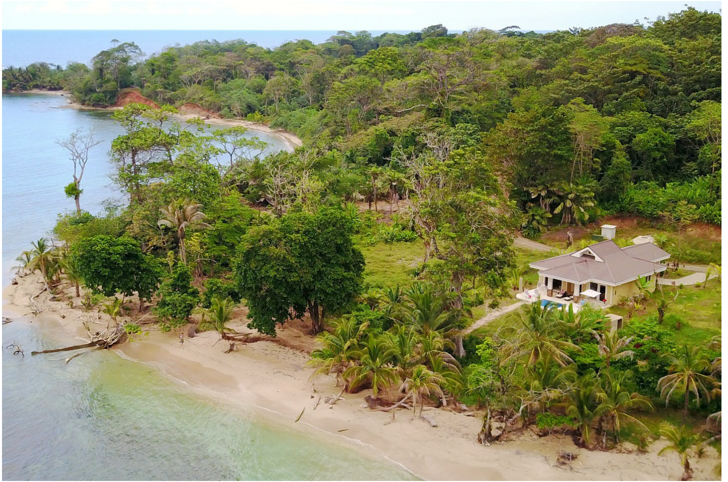
Bocas del Toro

Das Red Frog Beach Island Resort liegt an einem der schönsten Strände Panamas - entdecken Sie das tropische Paradies.