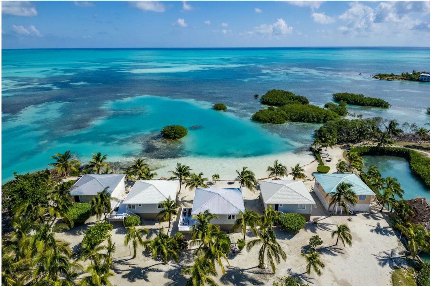
Little Frenchman Caye

Die persönlich geführte Privatinsel bietet einen Zufluchtsort für Ruhe- und Erholungsuchende.