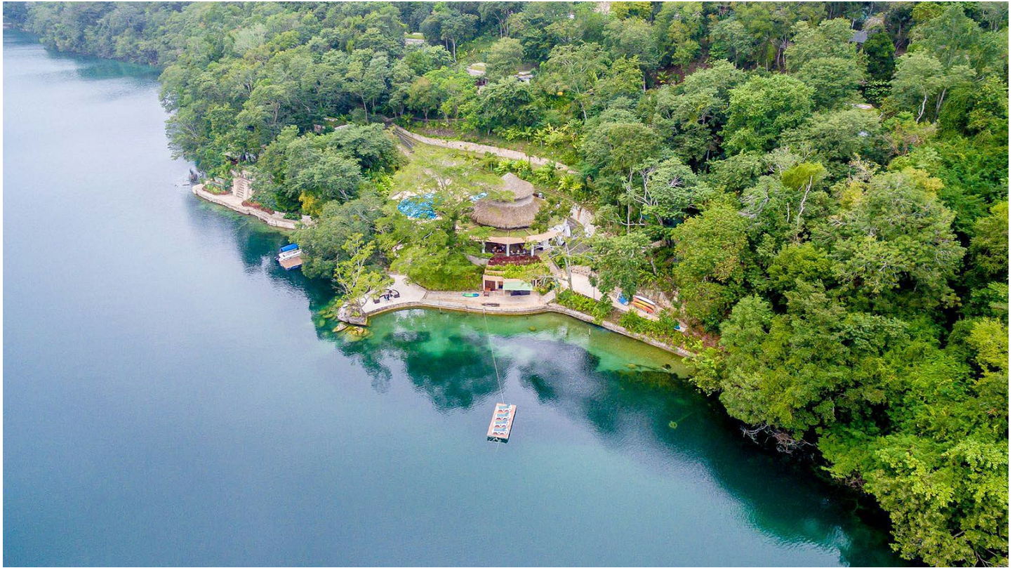
Lago Peten Itzá

Eine geschmackvolle, ruhige Oase an wunderbarer Lage am See mit besonderem Ambiente.