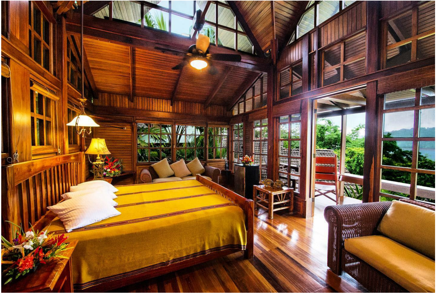
Osa Peninsula | Drake Bay

Die exklusive Lodge bietet viel Privatsphäre und die Möglichkeit, die wilde Umgebung der Halbinsel Osa zu entdecken ohne auf Komfort zu verzichten.