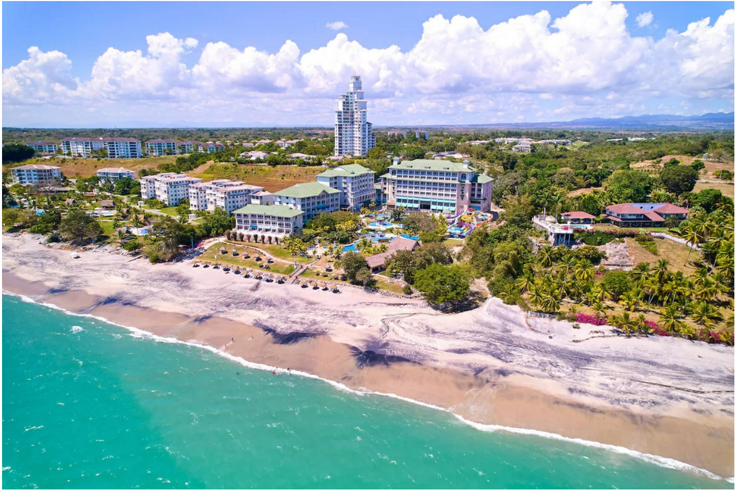
Guías de Anton

Dieses All-Inclusive-Resort bietet eine weitläufige Anlage und vereint tropisches Ambiente mit modernem Komfort, es Familien und aktive Gäste gleichermaßen an.