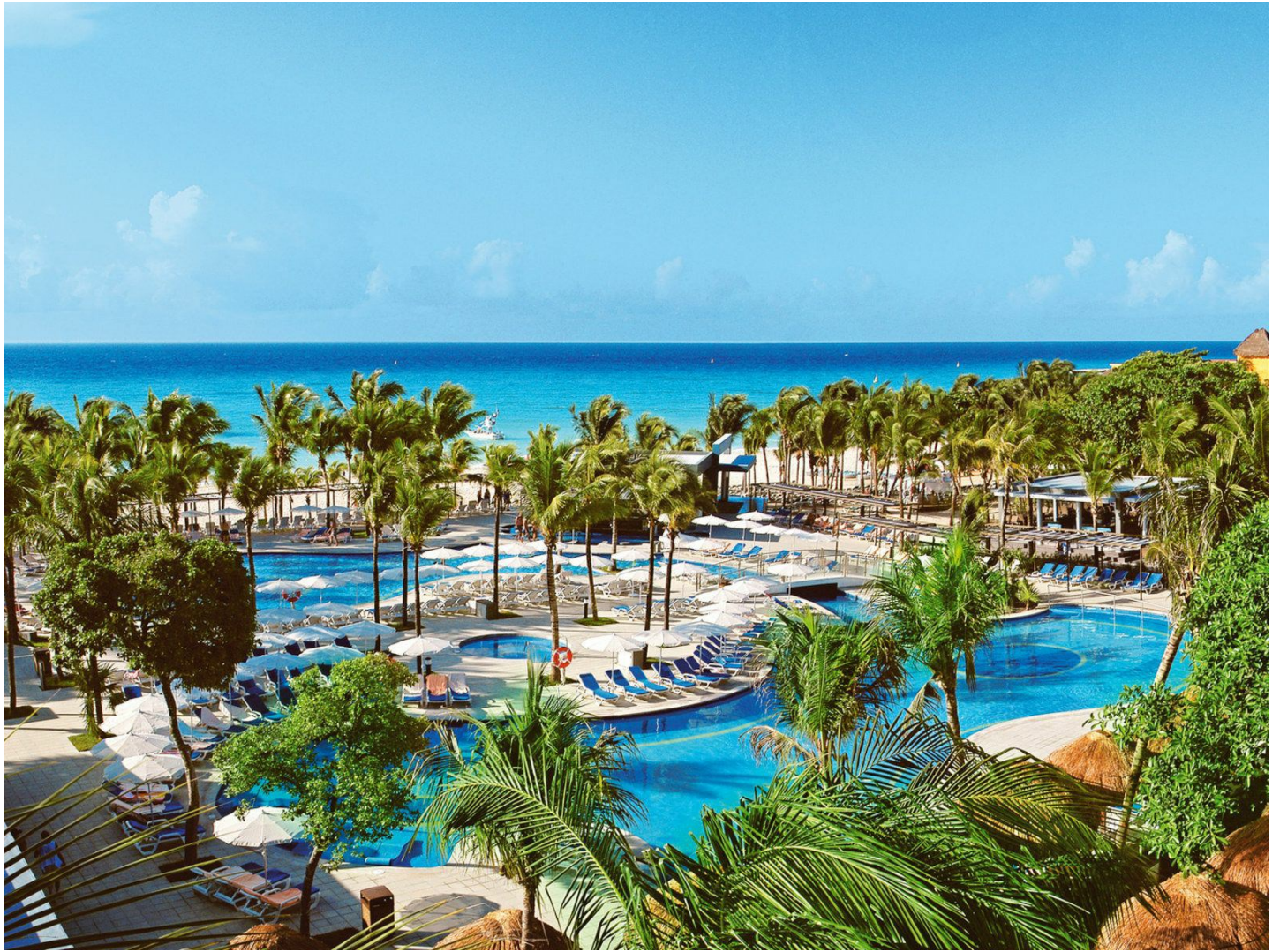
Riviera Maya | Playacar

Das lebhafteste All-inclusive-Strandhotel ist Teil des RIU-Komplexes in Playacar und bietet Zugang zu zahlreichen Freizeit- und Unterhaltungseinrichtungen der Umgebung.