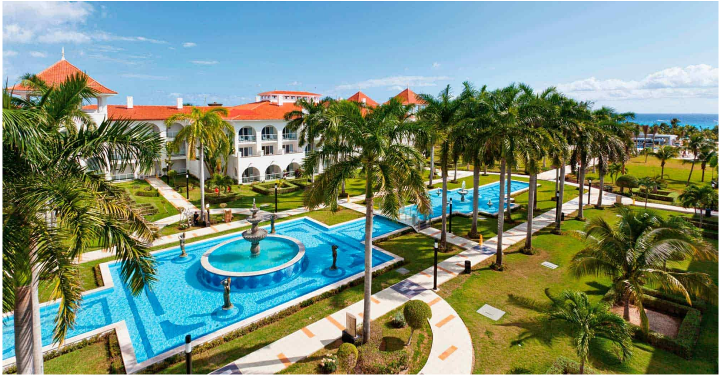
Riviera Maya | Playacar

Das beliebte All-inclusive-Erstklasshotel ist Teil des Riu-Komplexes in Playacar und bietet Zugang zu vielfältigen Freizeit- und Unterhaltungsmöglichkeiten.