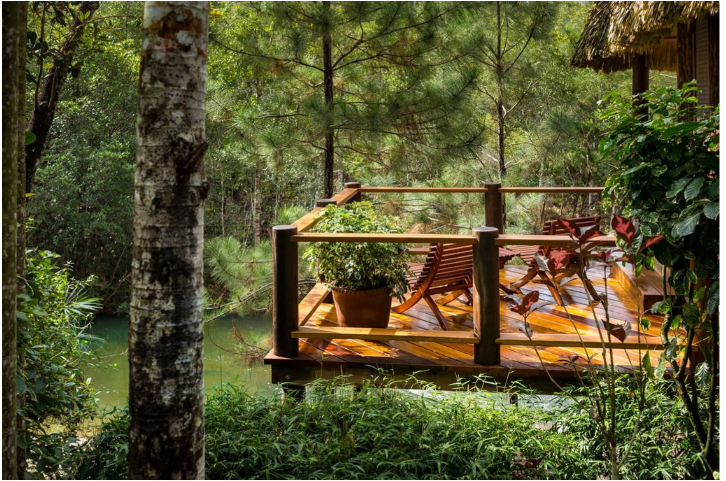
Mountain Pine Ridge Reservat

Die einzigartige Luxuslodge gehört dem Regisseur Francis Ford Coppola, der hier in einem kleinen Naturparadies seinen Hoteltraum verwirklicht hat.